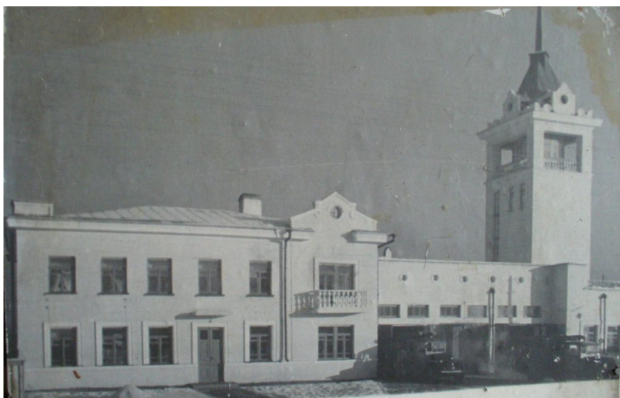
Фото № 7. Новое депо построено, 1952 год.

И только через полтора года состоялось долгожданное новоселье пожарников. Строительство нового кирпичного пожарного депо с пожарной вышкой было закончено, и абаканские пожарные обосновались в новом здании. Акт приемки нового здания пожарного депо Государственной комиссией от 27 октября 1952 года был утвержден на заседании исполкома Абаканского горсовета только спустя четыре месяца, 11 февраля 1953 года, после устранения недоделок [31].