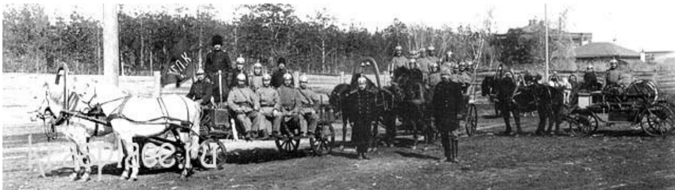
Фото № 2. Пожарный обоз г. Красноярска, начало

В 1931 году Абаканским городским коммунальным хозяйством и пожарной охраной были разработаны первые правила противопожарной охраны для города и станции Абакан. Один из пунктов этих правил гласил: «По пути следования пожарного обоза в городе Абакане, вслед за сигналом трубача, всем едущим давать место для проезда обоза». Противопожарные правила, изданные в отдельной брошюре, учреждения, предприятия и граждане г. Абакана могли приобрести в городской ДПО, по адресу: ул. Советская, 81 [3].