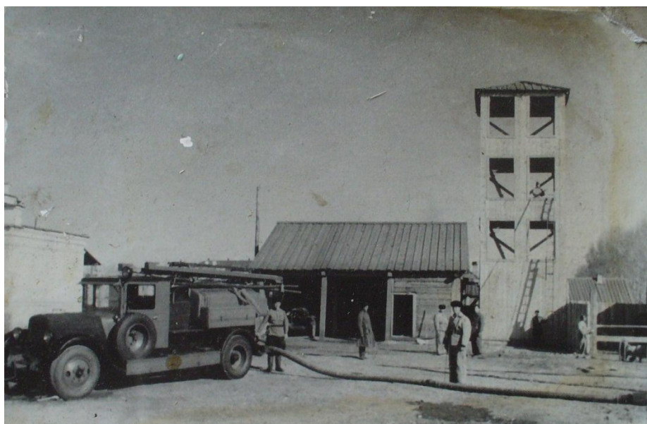
Фото № 5. Пожарная вышка, 1952 год.

Вся территория небольшого города просматривалась с деревянной пожарной вышки, а радиус выезда пожарных по городу в общей сложности составлял 6-8 км.