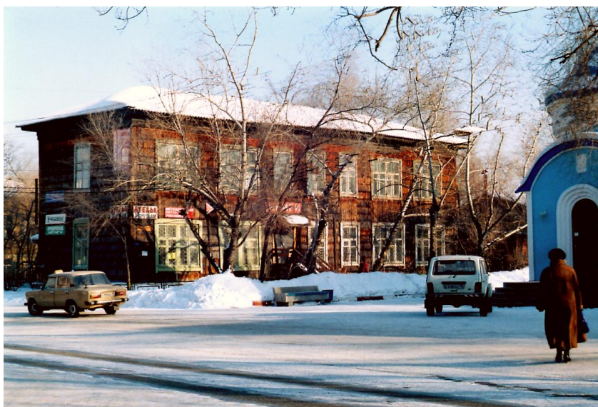
Фото № 4. В этом здании находилась Пожарная часть до 1951 года. Пожарное депо находилось рядом, справа на углу улиц Советская и Чкалова.

Новое каменное здание в ближайшие годы не построили, как собирались. Можно предположить, что часть отделов разместили в стоящем рядом Доме Обороны. Так называли здание, в котором находился Городской Совет добровольного общества ОСОАВИАХИМ (общество содействия обороне, авиации и химической промышленности), позже преобразованное в общество ДОСААФ. По воспоминаниям отдельных жителей в этом здании находилась Пожарная часть.