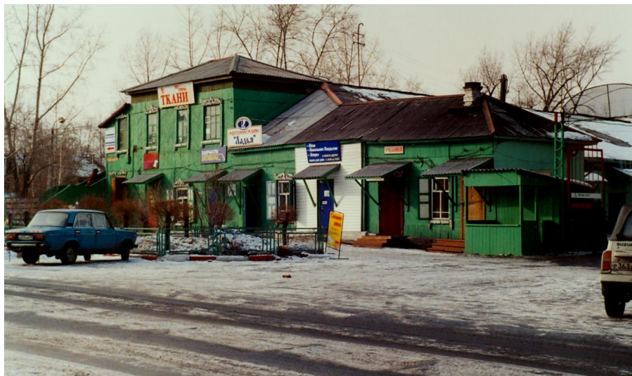
Фото № 8. Здание Ремонтно-обувной фабрики, 1999 год.

Рутинная работа Пожарной охраны продолжалась. На заседании Абаканского горсовета 29 февраля 1952 года в очередной раз рассматривался вопрос «О состоянии и мерах по усилению пожарной охраны в городе». Отмечено, что «в последнее время в городе произошло ряд возгораний и пожаров с нанесением убытков для государства. Пожары возникли в результате того, что отдельные руководители учреждений и организаций потеряли бдительность, не придали должного значения вопросам противопожарной безопасности. Они не извлекли уроков из имевшихся пожаров прошлых лет на объектах. Систематически не выполняют предложения Государственного пожарного надзора. Объекты не обеспечены средствами пожаротушения и противопожарным инвентарем, не практикуется строительство пожарных водоемов. Добровольные пожарные дружины не организованы». То есть, остались все прежние проблемы, сознательность отдельных руководителей на прежнем уровне.