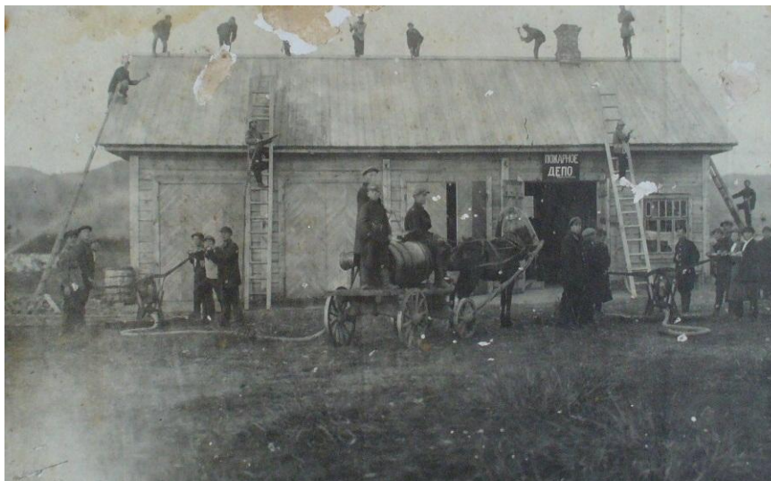
Фото № 1. Пожарное депо, 1927-28 годы.

Архивные документы могут рассказать много интересного о первых годах пожарной охраны молодого Абакана. Из сметы расходов на пожарную охрану в 1928-29 годы узнаем, что в пожарной охране было 13 человек, на обмундирование для них полагалось 975 рублей в год. Пожарные помещения отапливались 6 печами (затраты составили 240 рублей) и освещались 7 электрическими лампочками (125 рублей). «Транспортом» для пожарной команды служили 8 лошадей, на содержание которых уходило в год 960 рублей. На покупку лошади и нового колокола было потрачено по 200 рублей [2].