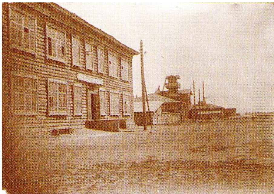
Фото № 3. Здание Пожарной части (далее видно Пожарное депо). 1935 год.

На заседаниях Абаканского горсовета часто обсуждаются вопросы о проблемах пожарной охраны: о расширении пожарного депо, о снабжении пожарным инвентарем, об обеспечении пожарников жильем. Так, на заседании 13 июля 1932 года ГКХ предложено в трехдневный срок отвести место под постройку нового пожарного депо. Один из выстроенных типовых домов забронировать специально для пожарной команды и разместить с таким расчетом, чтобы было не более 150 метров от депо. И уже через 3 недели принимают решение: новый дом № 8 заселить пожарниками [12].